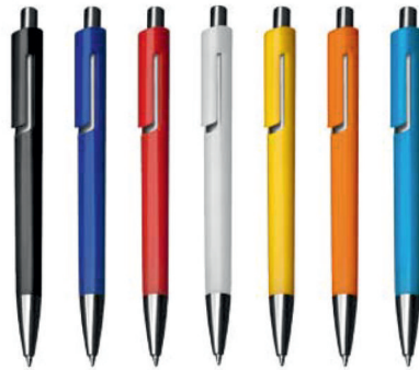
KEM. OLOVKA 13538 KATH. COLOR