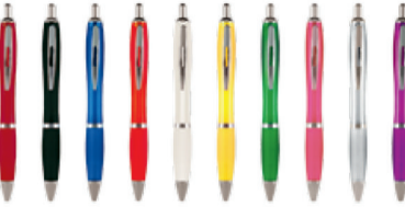
10 02 03 04 05 06 08 09 11 14 21 KEMIJSKA OLOVKA 3314 RIO COLOUR