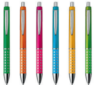
12 09 10 11 14 98 99 KEM. OLOVKA 7717 GLITZER